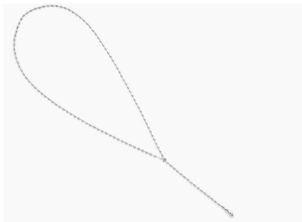
・ロングネックレス(Pt850,75cm)

流れるように雫が連なるシンプルエレガンスな 2WAY ネックレス。留める箇所を変えることで、U 字にも Y 字にもアレンジできます。