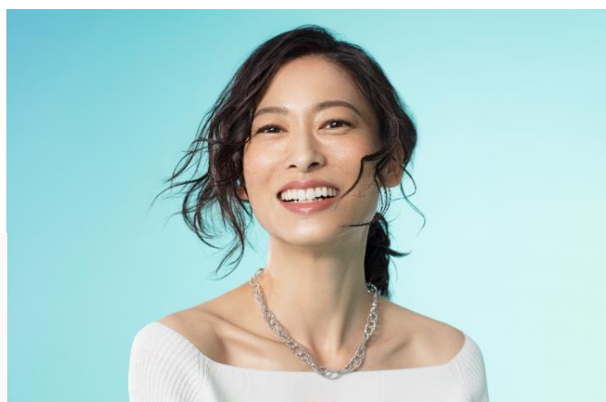
・ショートネックレス(Pt850,45cm)

オーバルのプラチナパーツが連なってグラデーションを描くショートネックレス。一つ一つのミラーボールがデコルテで高貴な輝きを放ちます